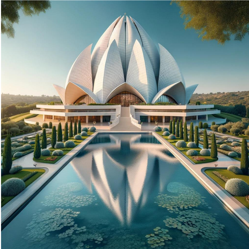
Bilde generert av ChatGPT: Bahaitempel, Påskekyllingar på veg frå skola, Ein cool påskekylling.