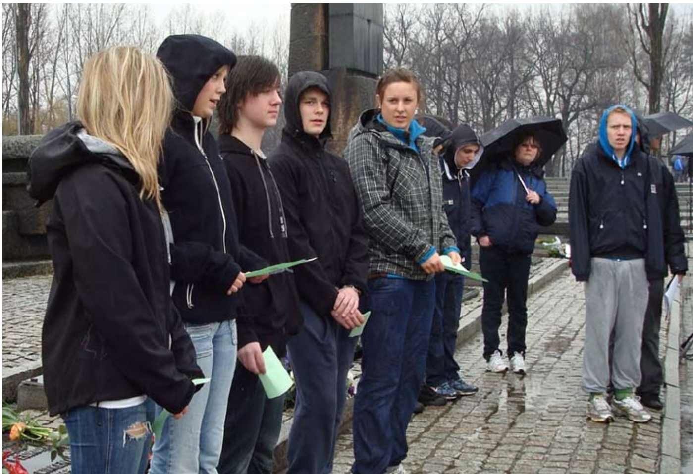
Fra fredsreisen i mars 2009. Minnestund i Auschwitz Birkenau.