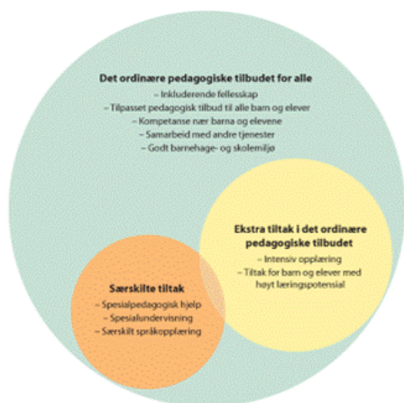
Figur 3.2 Inkluderande fellesskap i barnehage og skule (Meld. st. 6 s. 49.)

utfordringar vert avdekkja. Tiltak kan vera å leggja til rette innanfor det ordinære tilbodet og/eller ved å setja inn særskilte tiltak.»