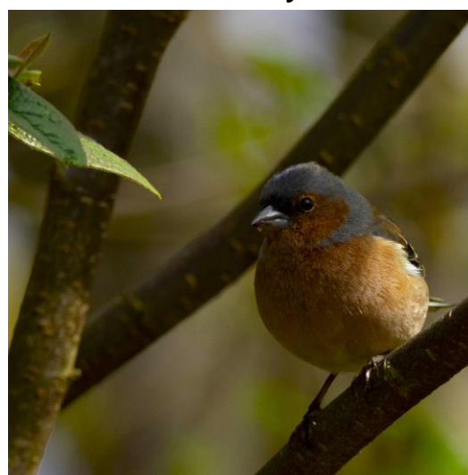
Grønnfink og bokfink