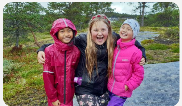
Hilsen lærerne på 5.trinn