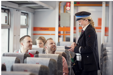
konduktør er ansvarlig for passasjerenes sikkerhet ved av- og påstigning.