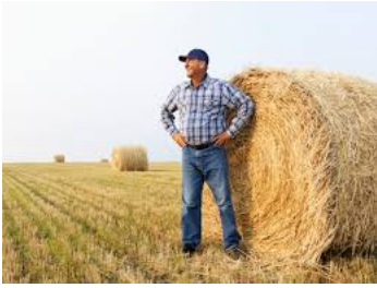
bonde en som jobber på en bondegård.