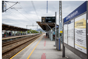
togstasjon/ perrong stoppeplassen til togene. Man må opp på en perrong for å gå ombord på et tog.