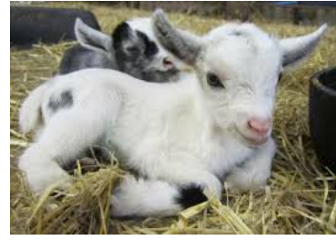
killing geitas barn