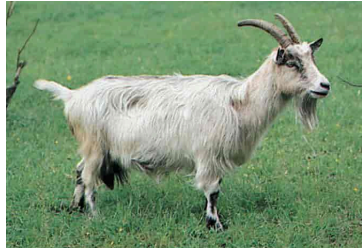
geit vanlig norsk husdyr