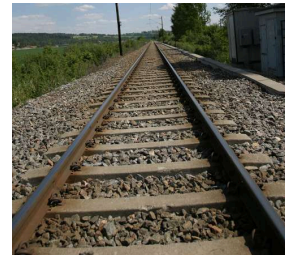
toglinje/ togskinne "banen" som togene kjører på