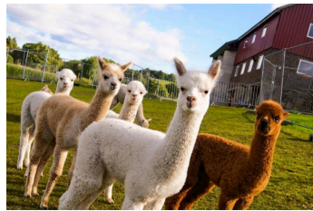
alpukka husdyr, opprinnelig fra Sør-Amerika