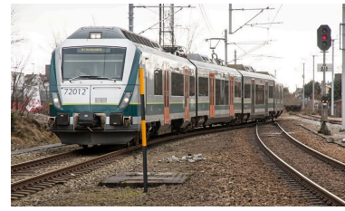
tog kollektivt framkomstmiddel