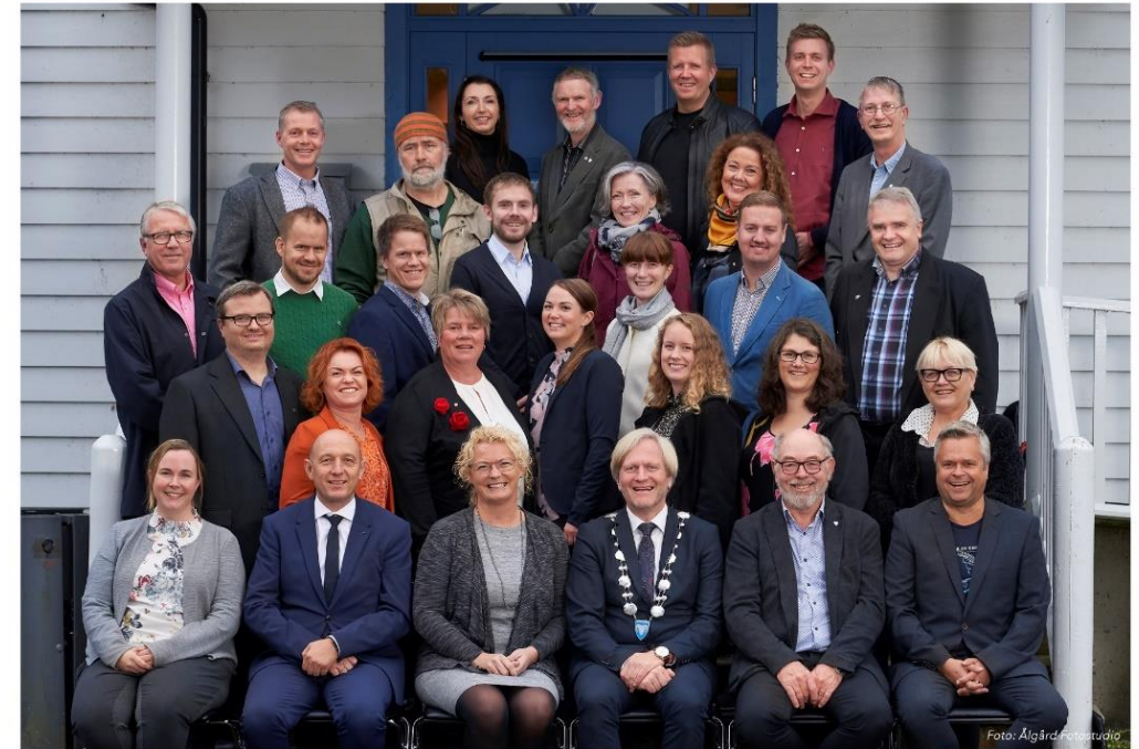
Kommunestyret 2019 -2023