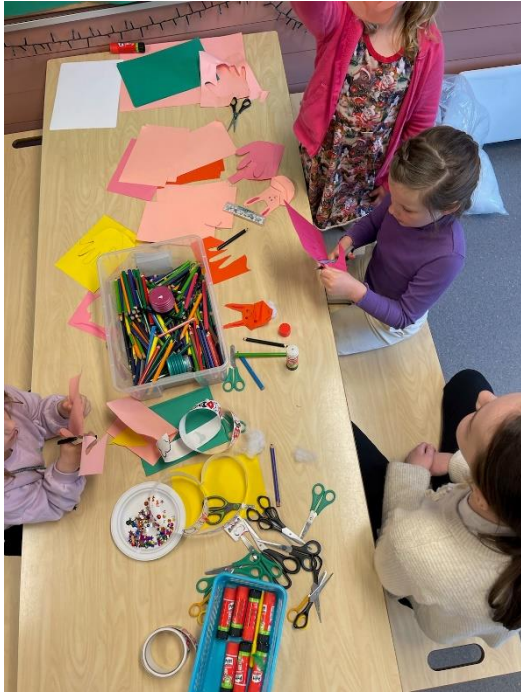
Den store SFO dagen: