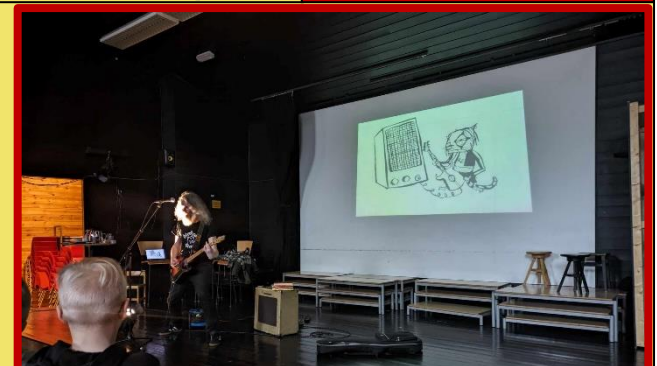
DKS-framsyning: «Kattesnakk». Forfattar snakkar om bøkene sine og spelte rockemusikk.

Skulen si heimeside: www.minskole.no/Samnanger , Telefon til skulen: 565 89 980