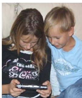
Hode-/hårkontakt er den største smitekilden.

Vi har laget en PowerPoint-presentasjon om hodelus, som kan benyttes til undervisning. Presentasjonen kan lastes ned fra vår nettside.